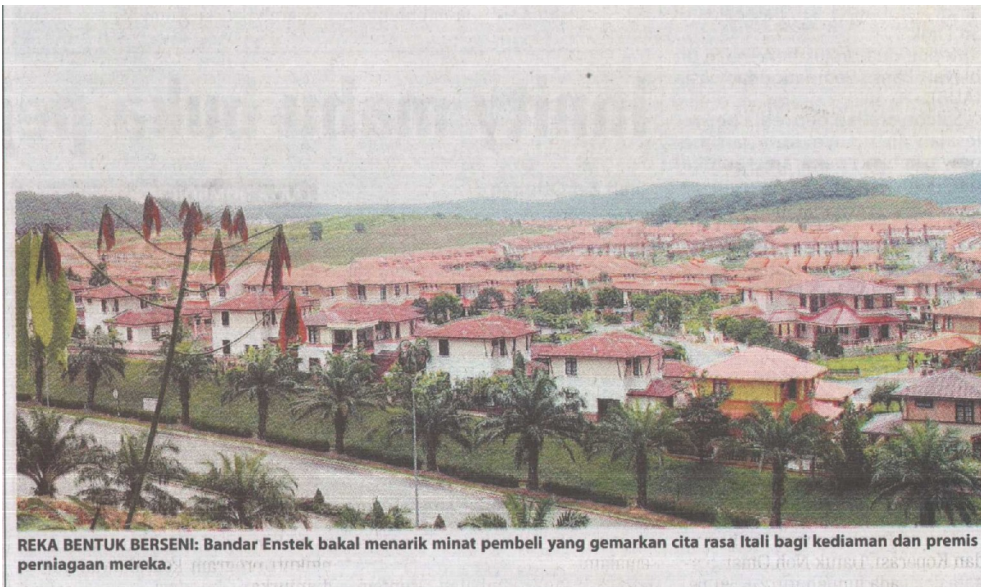
REKA BENTUK BERSENI: Bandar Enstek bakal menarik minat pembeli yang gemarkan cita rasa Itali bagi kediaman dan premis perniagaan mereka.