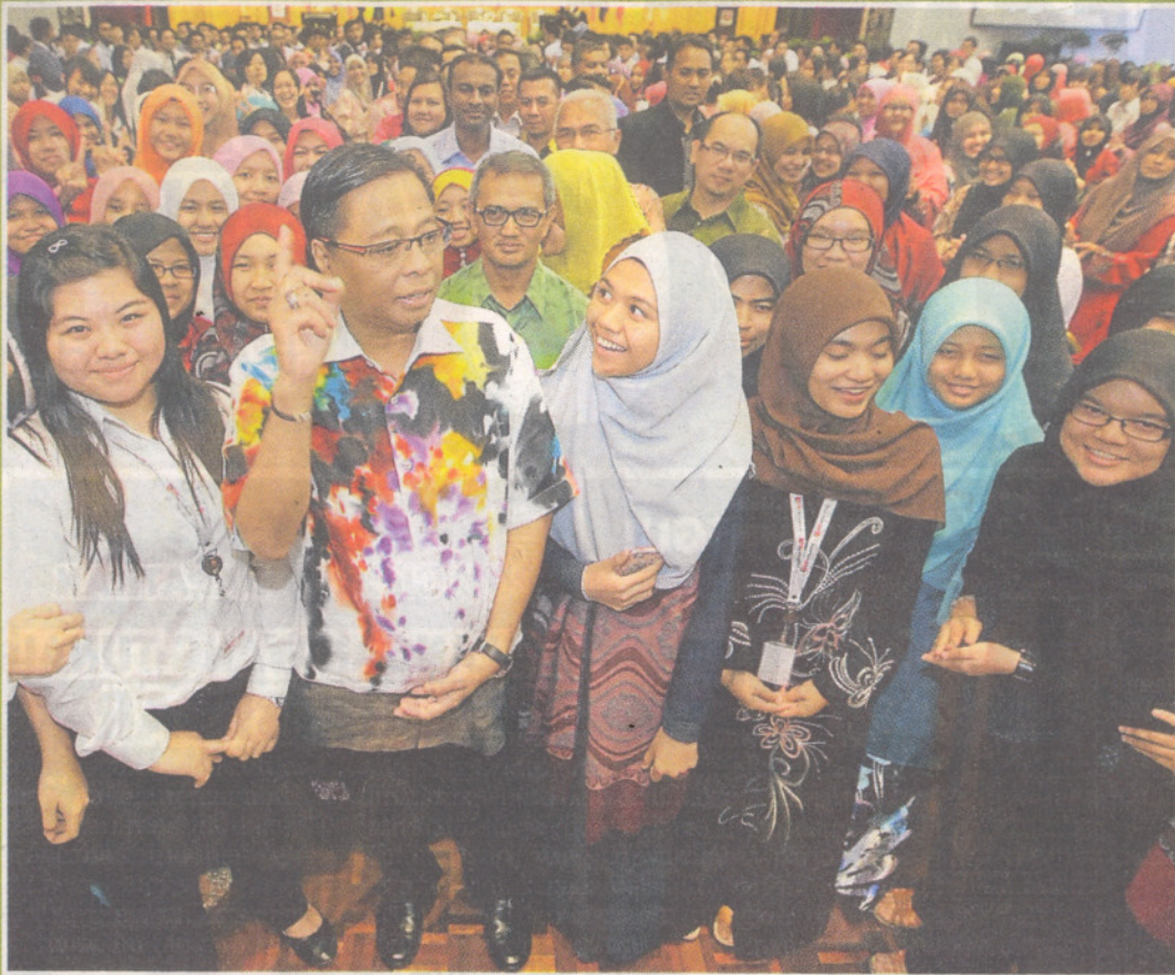
Ismail Sabri berbual dengan penuntut universiti sempena Minggu Perkasa Putra Pelajar Baru Semester Pertama Sesi 2013/2014 di UPM, Serdang, baru-baru ini.