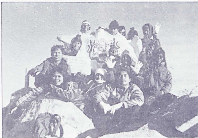
Riang dan megah semasa berada di puncak

Keesokan harinya mereka bertolak ke Yayasan Sabah