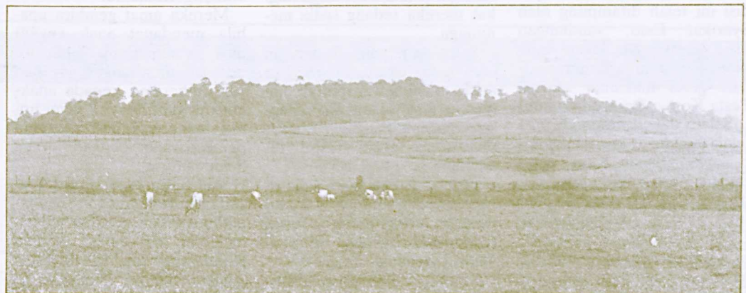
Ladang ternakan di Puchong

Harga pasaran hasil ladang ditetapkan oleh pihak pema-