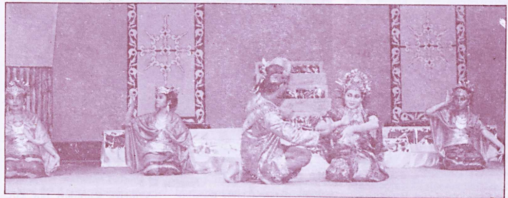
Salah satu persembahan yang telah dipentaskan oleh pelajar PBMP

Sempena Hari Fakulti Pengajian Pendidikan, pelajar terbabit telah mempersembah-