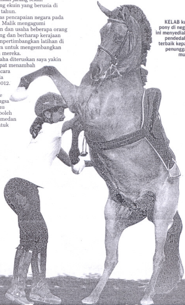
KELAB kuda pony di negara ini menyediakan pendedahan terbaik kepada penunggang muda.

"Sukan ekuin memerlukan kepakaran banyak pihak contohnya jurulatih, veterinar, juru ladam dan sokongan daripada industri kuda," katanya.