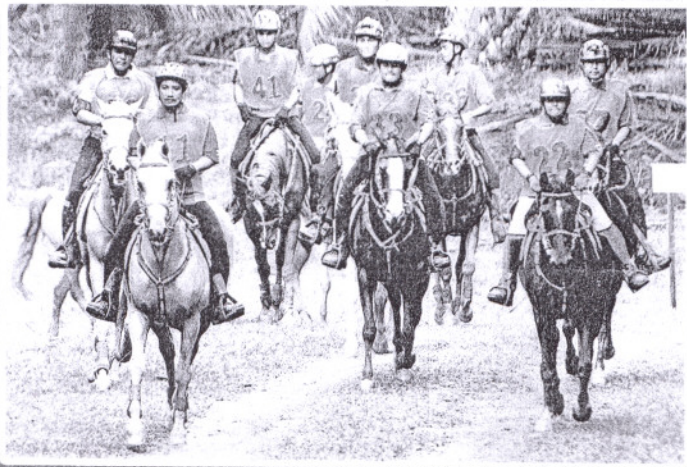
PENGLIBATAN Tuanku Mizan Zainal Abidin (depan) diharap memberi lebih suntikan kepada sukan ekuin negara.