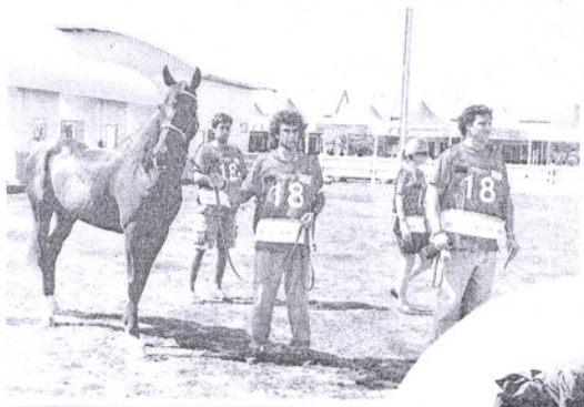
TIEP yang menyediakan kemudahan seperti klinik dan hospital kuda diharap tidak akan menjadi 'projek gajah putih'.