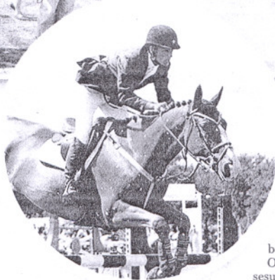
SHOWJUMP merupakan salah satu daripada disiplin utama ekuestrian.

30 orang meningkat kepada 100 menjelang 2020," katanya.