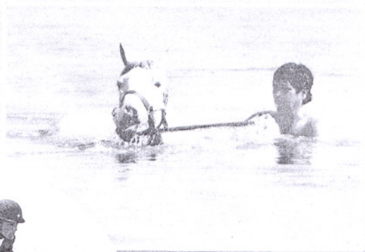
TIEP di Lembah Bidong antara gelanggang terbaik bagi sukan kuda lasak di rantau ini.