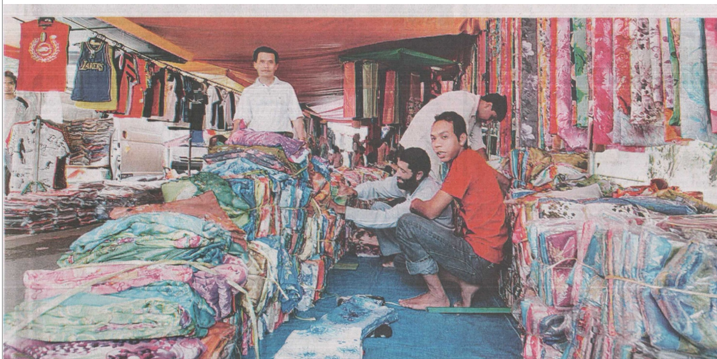
PELBAGAI jenis kain dan pakaian dijual pada harga berpatutan di Pasar Kampuchea di Kampung Kanchong Darat, Kuala Langat.