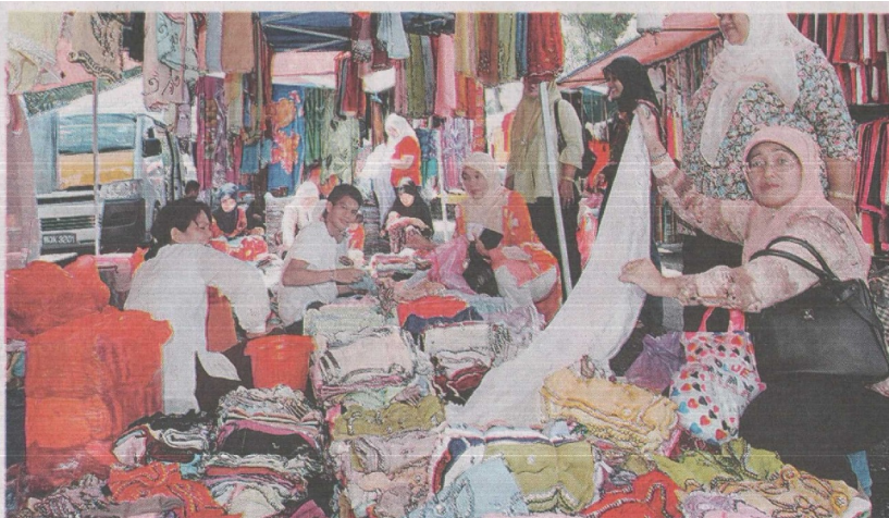
KAIN tudung yang dijual pada harga murah menjadikan Pasar Kampuchea menarik tumpuan penduduk sekitar Kuala Langat.